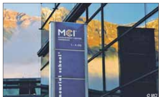
Höchste Praxisrelevanz, enge Kooperation mit der Wirtschaft, unternehmerische Dynamik, kontinuierliche Innovation sowie intensiver und persönlicher Support der Studierenden stehen am MCI im Vordergrund.

Das dynamische Career Center unterstützt die Studierenden mit Seminaren, Workshops, Jobmessen, einer exklusiven Online-Jobbörse und vielem mehr. Unternehmen schätzen die Qualität der Ausbildung und die vielfältigen Möglichkeiten, sich auf dem MCI-Campus als attraktiver Arbeitgeber zu präsentieren.